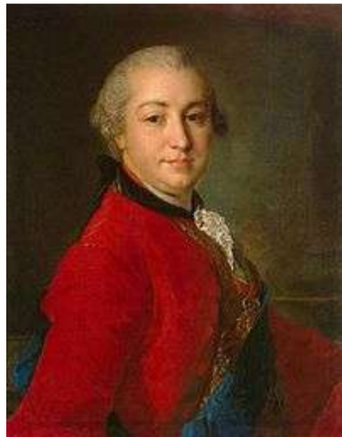
Иван Иванович Шувалов (1727-1797) — русский государственный деятель, генерал-адъютант (1760), фаворит императрицы Елизаветы I Петровны, меценат, основатель Московского университета и Петербургской Академии художеств

Традиция отмечать значительные события торжественными речами, фейерверками, театральными представлениями происходит с 1755 года, что так нравилось Екатерине.