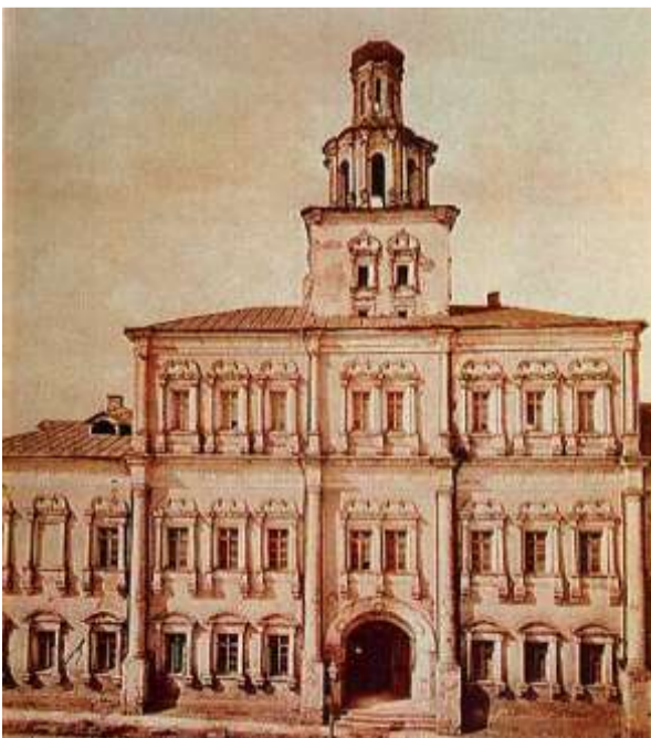
Первое здание Московского университета, 1755 г.