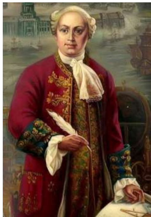
Михаил (Михайло) Васильевич Ломоносов (1711-1765) — первый русский учёный-естествоиспытатель мирового значения, энциклопедист, химик и физик