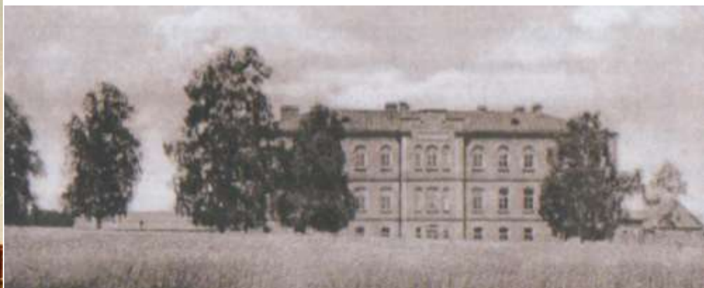
Здание лесного техникума, 1921 год