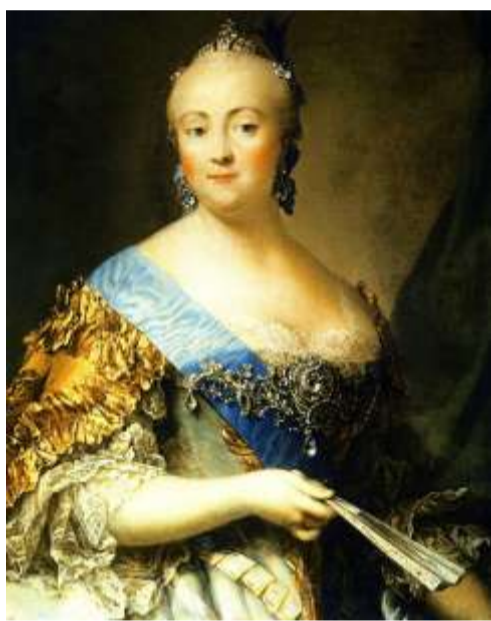
Елизавета I Петровна — российская императрица из династии Романовых с 25 ноября (6 декабря) 1741 года

Татьянин день ещё традиционно считается праздником всех студентов. Именно в этот день, 25 января (12-го по старому стилю) российская императрица Елизавета Петровна по-